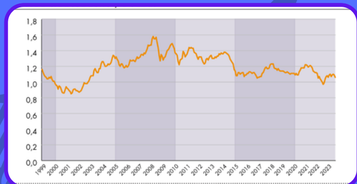
Evolution du taux de change euro/dollar

Les différentes devises en circulation suivant les zones géographiques